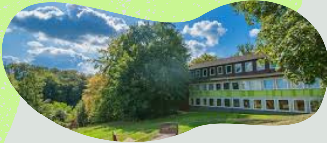
Leben und Lernen im Grünen

Das Teamer Training Wochenende bereitet Dich für Deine Rolle als Teamer:in in der Kinder- und Jugendarbeit vor und begleitet Dich auf Deinem Weg. Zusammen mit Jugendlichen aus anderen Jugendarbeiten der Evangelischen Jugend Essen und aus anderen Essener Gemeinden erlebst du eine abwechslungsreiche und intensive Zeit.